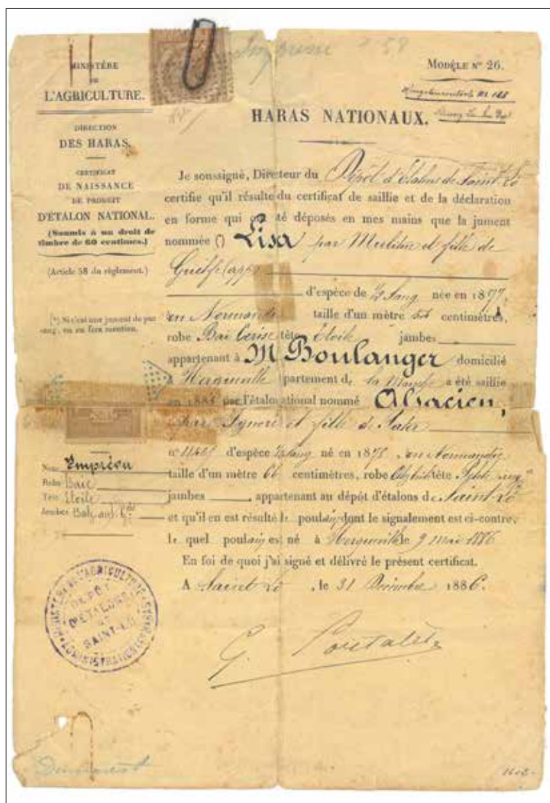
Son certificat de naissance a récemment été transmis aux Archives cantonales jurassiennes par un donateur. Le document a été rendu public hier sur la toile.