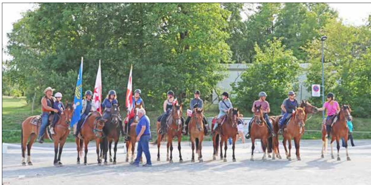
Un groupe de cavaliers valaisans a rallié Saignelégier depuis la région d'Entremont pour prendre part au Marché-Concours.