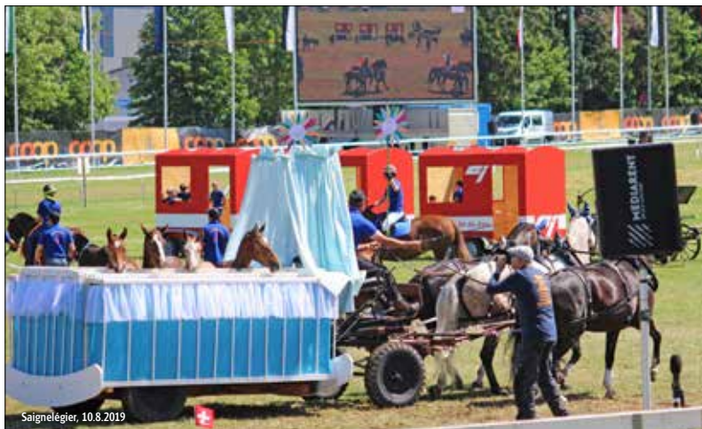
Malgré le spectacle né de la collaboration entre les deux syndicats chevalins du district (ici le berceau de la race), l'heure n'est surtout pas à la fusion.