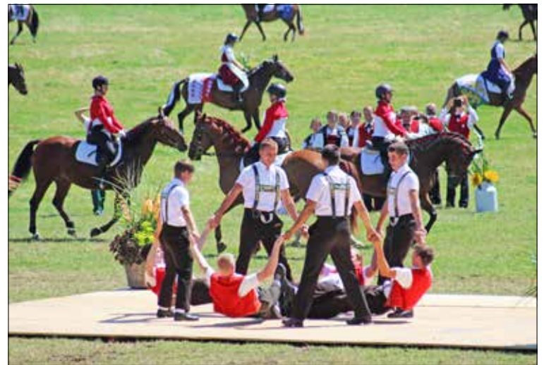
Dances et présentations de costumes: du folklore, toujours du folklore!