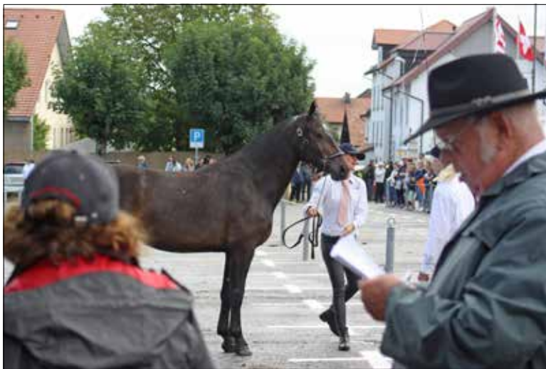
Les plus beaux spécimens, sous l'œil des experts.