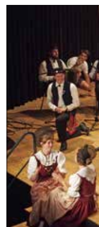
La scène de la halle-