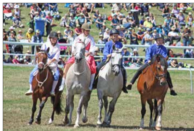
Le quadrille conjugué au féminin-masculin.