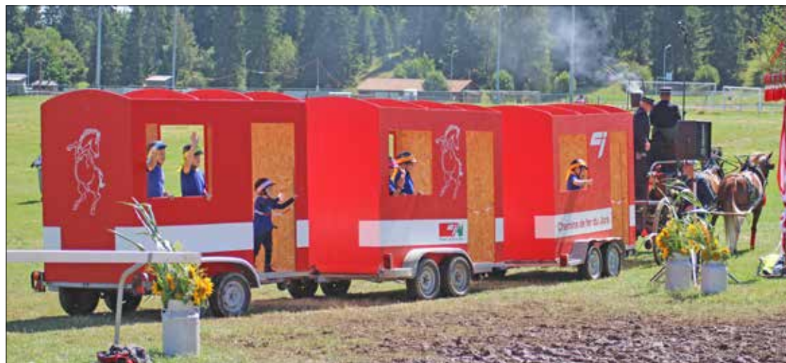
Le «petit train rouge qui bouge»... au rythme des syndicats invités.