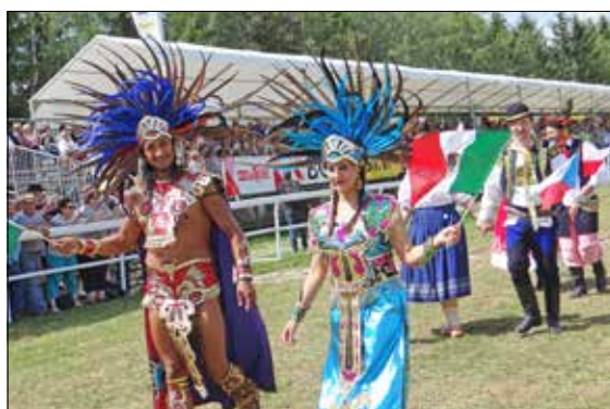
Il paraîtrait que ces deux superbes Incas (ou serait-ce des Mayas?) ont laissé quelques yodleurs sans voix.