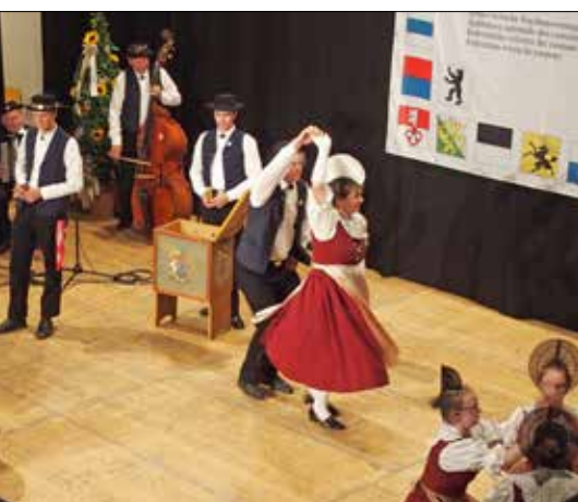
cantine, transformée en «dancefloor».