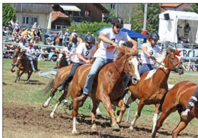
Qui se détachera du peloton et s'échappera pour de bon?