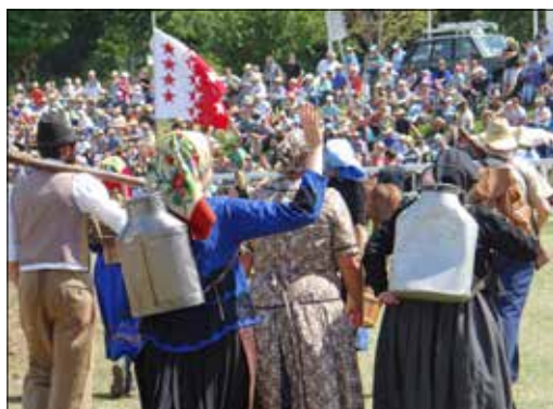
Du Valais à Saignelégier, les hôtes ont effectué ce qu'ils appellent: «une petite désalpe».

Les costumes... Comment décrire tant d'élégance? De diversité? L'étoffe et les ornements de tant de traditions? Peut-être en criant «Youyouyouyou-houhouhou!». Le (bon) écho ne se fera pas attendre. (rg)