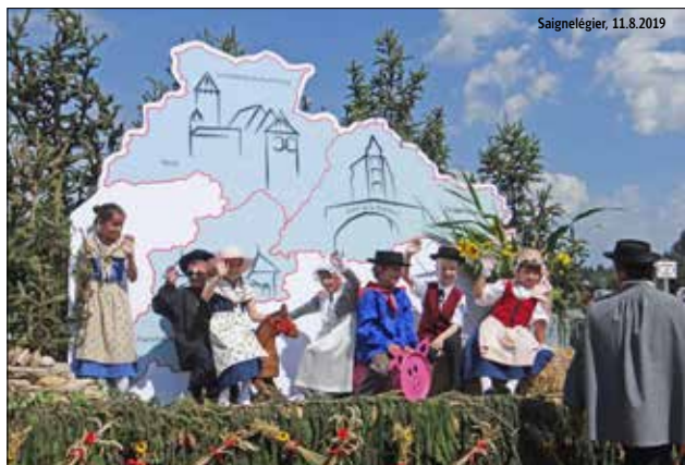
Petits Taignons, Vadais et Ajoulots ont porté fièrement le costume de leur district. Le petit Prévôtois a dû attendre...