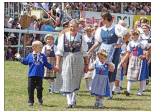
«Pourquoi, moi, je n'ai pas de fleurs dans mes cheveux?» semble demander ce petit Lucernois.