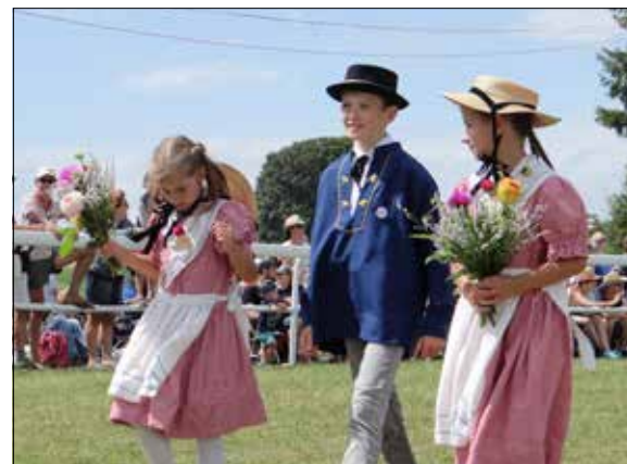
Les filles en rose, les garçons en bleu. Un cliché? Non, un des costumes de la délégation neuchâteloise.

Dérogeant à la coutume, le Marché-Concours n'a pas invité un Etat confédéré pour sa 116 e édition. Il a fait mieux. Il s'est offert 26 échantillons folkloriques des cantons et demi-cantons helvétiques. Hôte d'honneur, la Fédération nationale des costumes suisses (FNCS) a porté fièrement les couleurs de la tradition lors du cortège dominical.