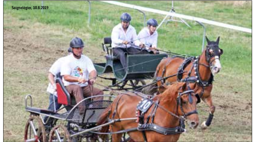
Fait exceptionnel cette année, les ressortissants de tous les cantons jouissaient d'un passe-droit pour concourir sur l'hippodrome éphémère du Marché-Concours.

Au total, une bonne quinzaine de cavaliers-atteleurs de l'extérieur se sont