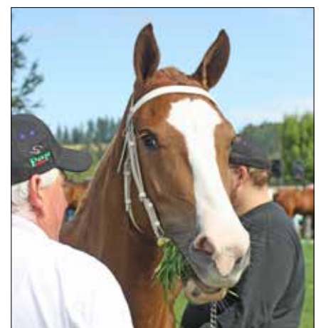
Pause des dix-heures!