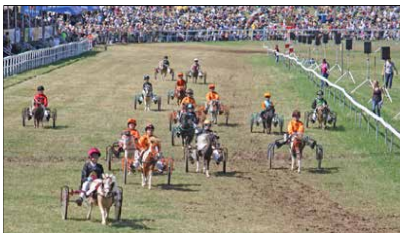
Petits poneys, jeunes drivers et grand plaisir!